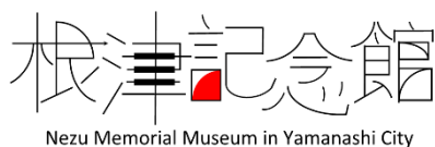
Nezu Memorial Museum in Yamanashi City