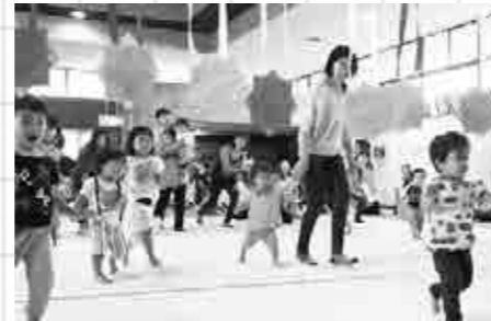
※この企画は子育て支援課・健康増進課・生涯学習課の協働事業です。