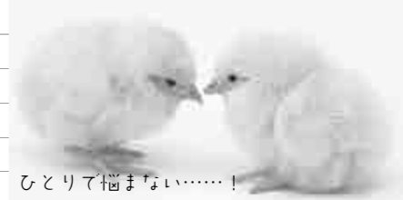
ひとりて悩まない……！