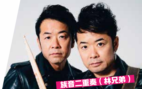
族音二重奏（林兄弟）