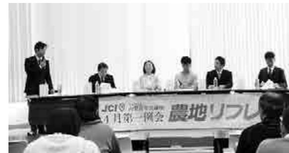
フォーラムでのパネルディスカッション

現代田舎の自然環境との関わり方、利用の仕方について新しい道を探し出す一助になるように、と企画されたこのプロジェクト。地域の農業を考えるフォーラムと、実際に田畑での開墾体験を実施。これからの農地環境のあり方について考える良い機会となりました。