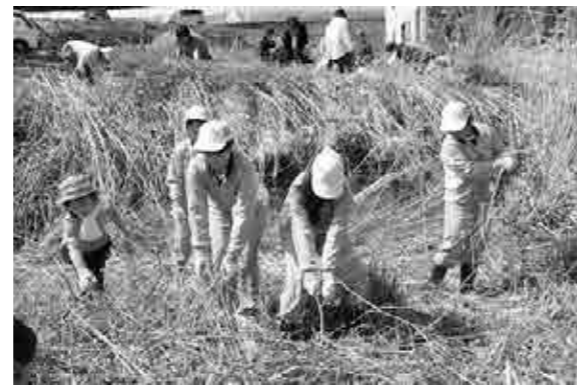
田畑の再生のための開墾体験

4月30日、山梨青年会議所の主催により「まちづくりフォーラム農地リフレッシュプロジェクト 農地リフレ」が開催されました。