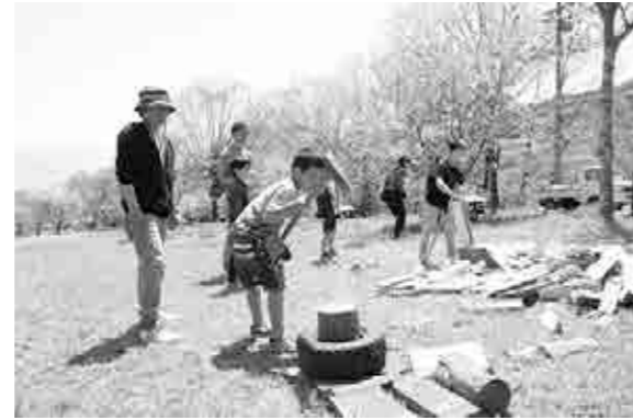
薪割り体験をする親子

夢のマルシェではいろいろな食べ物もあり、こどもレストランでは、小学生が作ったカレーの提供もありました。また、森林セラピープチ体験や、パラグライダーのふわっと体験などいろいろな体験コーナーもあり、参加者は思い思いに楽しんでいました。