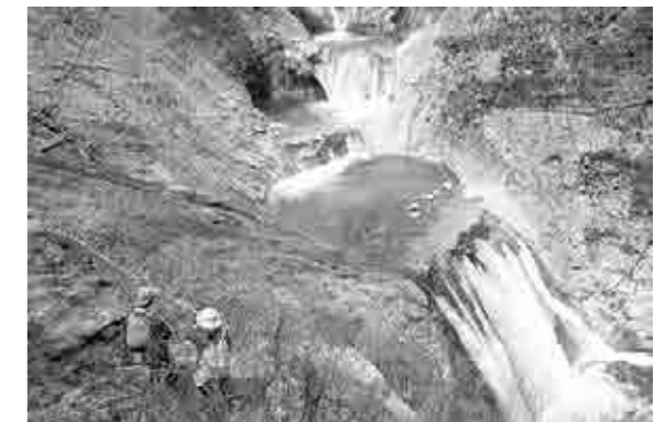
絶景を楽しむ入山者