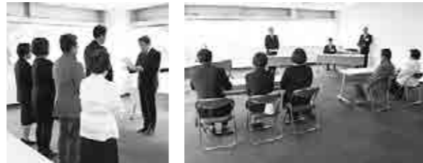
4 月 27 日に開催された委嘱式の様子

担当地域内の生活困窮者・高齢者・障害者・ひとり親家庭などの要援護者への相談、援助、適切な福祉サービスの情報提供などの活動を行なうほか、市役所や関係機関と協力し合い、地域福祉の増進に努めます。