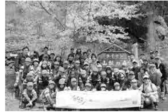
みんな揃って記念撮影！