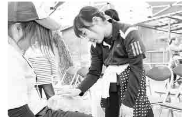
かわいいウサギとのふれあい体験