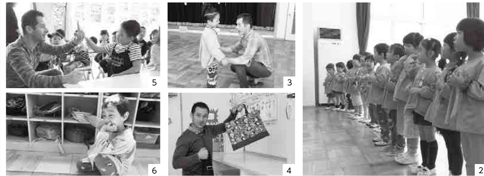
1. 英語教室の始まりは先生の言葉から「Let's speak English! さあ、英語教室の時間だよ！」 2. 英語の歌を歌って楽しく英語を学びます 3. 一人ずつ自己紹介の練習「What's your name? あなたの名前は?」「I'm ○○. わたしは○○です」 4. 「きかんしゃトーマス」の手提げ袋がトーマス先生のトレードマーク 5. 上手に発音できたね! ハイタッチ! 6. 英語で色探しゲーム「カバンの中にピンク色を見つけたよ!」

第2回目となった4月25日・27日 後屋敷保育園、山梨保育園、八幡保育園に取材をしました