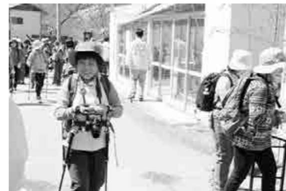
安全祈願餅が配布されました

現代田舎の自然環境との関わり方、利用の仕方について新しい道を探し出す一助になるように、と企画されたこのプロジェクト。地域の農業を考えるフォーラムと、実際に田畑での開墾体験を実施。これからの農地環境のあり方について考える良い機会となりました。