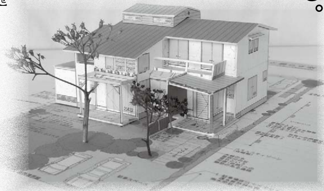
エコハウス完成予想図

※自立循環型住宅……気候や敷地特性などの自然エネルギーを活用しながら住みやすさを向上させ、さらに居住時のエネルギー消費量（CO 2 排出量）を2000年頃の標準的な住宅と比較し、50%にまで削減できる住宅の設計。