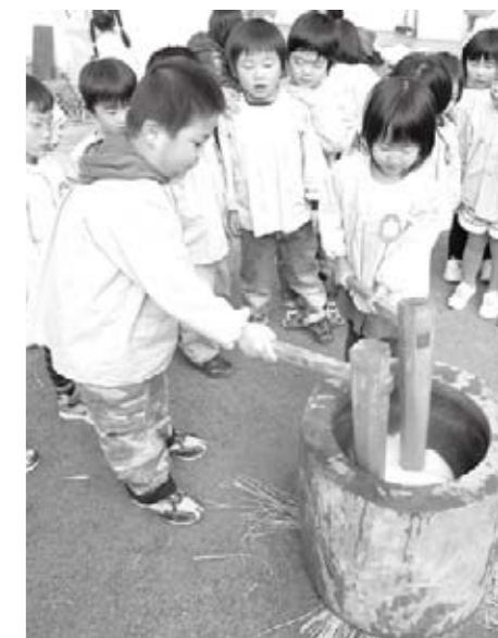
つきたてのおもちの味は……? 保護者と一緒にお餅つきに挑戦した園児たち。杵は重かったけど、がんばったよ。つきあがったお餅は、皆でおいしく食べました(12月8日・八幡保育園)。