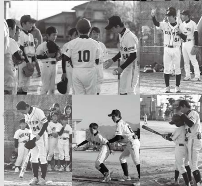
このようすは、テレビ山梨・開局40周年記念特別番組「ウツティ発！夢にトライで真イヤー!!」で1月1日午後2時30分から放送される予定です。