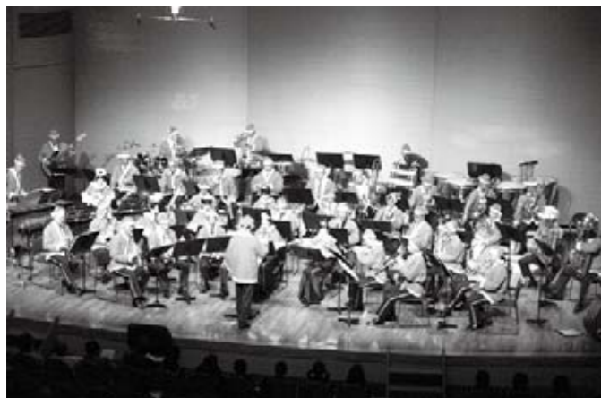
クリスマスには、やっぱりこのコンサート (12/13)

市民会館で開催された「子どもの健全育成を考える全国大会」。元プロ野球選手や大学教授などのパネリストが、自身の体験から「個性を伸ばしてあげる」「1日1回ほめることを探す」などと話すと、多くの方がうなずいていました。