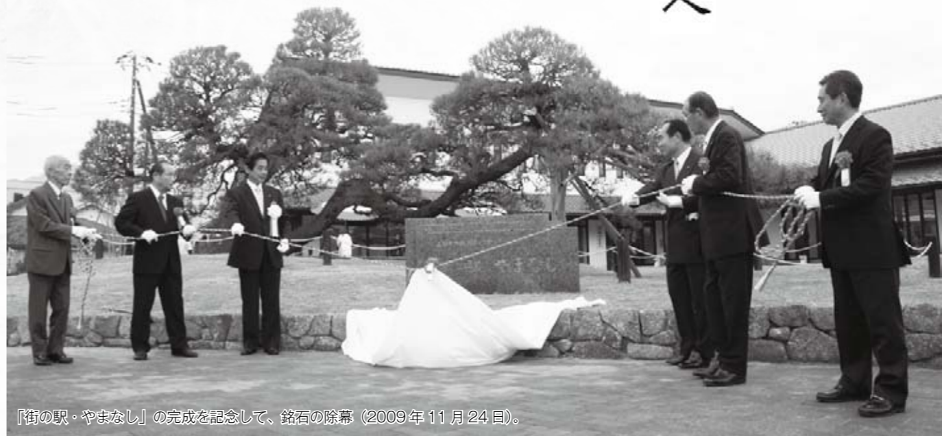
『街の駅・やまなし』の完成を記念して、銘石の除幕（2009年11月24日）。

この施設の建設は、平成5年に着手した駅前区画整理事業において、「地域振興に寄与する何らかの多目的施設を建設する」という位置付けで始まり、平成15年度に整備検討委員会を立ち上