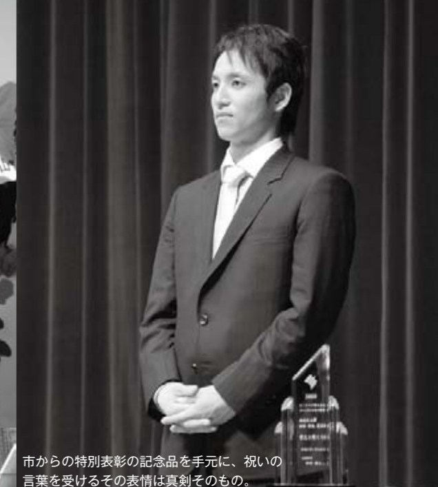
市からの特別表彰の記念品を手元に、祝いの言葉を受けるその表情は真剣そのもの。