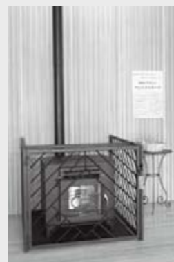
市役所東館ロビーにあるペレットストーブ