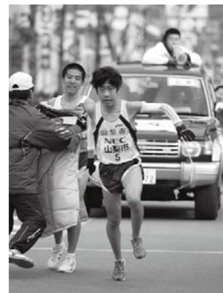
初冬の甲斐路で健脚を競いました 12月5・6日に開催された県下一周駅伝競走大会。山梨市を駆け抜けたランナーに多くの市民が声援を送りました。山梨市チームは、総合で第15位でした。