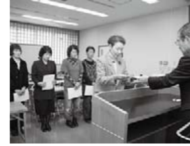
井戸副市長から修了証書を受け取る講習会修了者。

●総合政策課政策推進担当 （西館4階、内線2426） 市は、11月26日、「食育ボランティア講習会」の修了者6人に修了証書を交付しました。