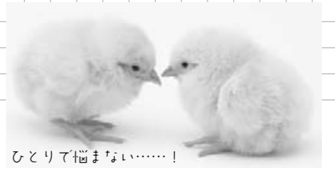
ひとりで悩まない……！