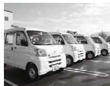
納品を終えたばかりのハイブリッド車4台（11月18日・納車式にて）。

●管財課管財担当 （西館3階、内線2347） 市では、このほど、15年以上が経過し、燃費の悪い公用車を廃車し、環境負荷の低いハイブリッド車を購入しました。今回入れ替えた公用車は全部で4台。国の経済危機対策臨時交付金を活用して購入したものです。