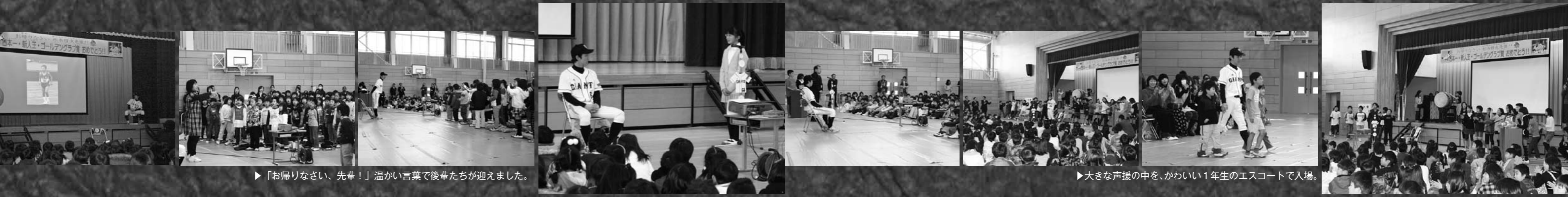
▶「お帰りなさい、先輩！」温かい言葉で後輩たちが迎えました。