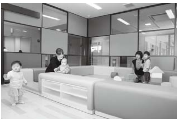
作品展などに活用できる多目的コーナー（上）。いつでも楽しく遊べるチャイルドスペース。授乳室も併設（下）。

を訪れ、館内の展示物を見たり足湯を楽しんだりしていました。また、チャイルドスペースでは、市内外から訪れた親子がにこやかに遊んでいました。「街の駅やまなし」は、地域や世代を問わず、多くの人が気軽に訪れ、活用できる施設づくりを目指しています。お近くにお越しの際は、ぜひお立ち寄りください。