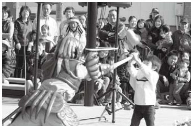
一番人気は……「侍戦隊シンケンジャー」ショー (11/29)

恒例となった自衛隊によるクリスマスコンサート。会場となった花かげホールは、今年も超満員でした。クリスマスソングを中心とした第2部では音楽隊全員がサンタの衣装に身を包んで登場!会場からは大歓声が上がっていました。