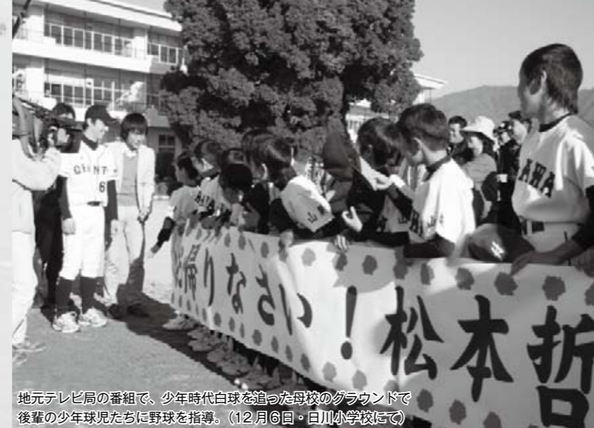
地元テレビ局の番組で、少年時代白球を追った母校のグラウンドで後輩の少年野球児たちに野球を指導。(12月6日・日川小学校にて)