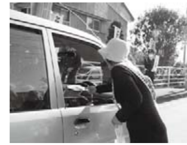
運転手にチラシなどを手渡ししながら、交通安全を呼び掛ける母の会会員。

●管財課管財担当 （西館3階、内線2347） 市では、このほど、15年以上が経過し、燃費の悪い公用車を廃車し、環境負荷の低いハイブリッド車を購入しました。今回入れ替えた公用車は全部で4台。国の経済危機対策臨時交付金を活用して購入したものです。