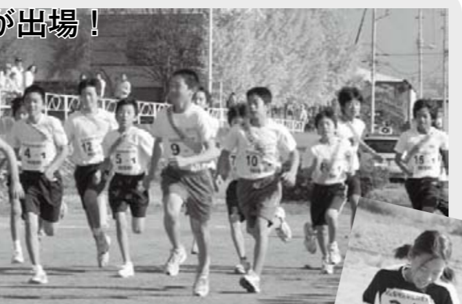
▲スタートの号砲と同時に、優勝を目指して一斉に飛び出す中学生男子。 ▶無事ゴール!小学生女子。走り終えた爽快感が、写真からも伝わってきます。

小学生<男子> 日下部男バスケA <女子> 塩山フレンド 中学生<男子> 塩北EKチーム <女子> 塩山中学校女A <一般> 八幡体協