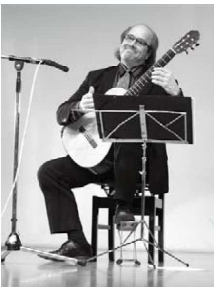
ヘイキ・マトリック ギターリサイタル エストニアの民族音楽や日本の「さくら」など8曲が演奏され、多くの観客が心地よいギターの音色に酔いしれました(11月28日・市民会館ホール)。