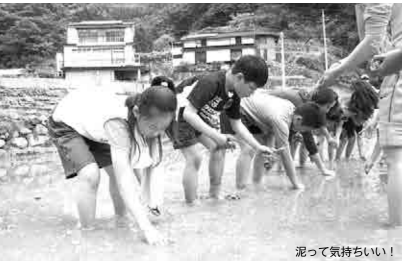
泥って気持ちいい！