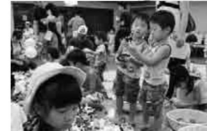
毎回大人気のおもちゃの「かえっこ」