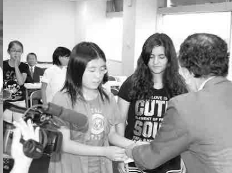
緊張しながら種を受け取りました