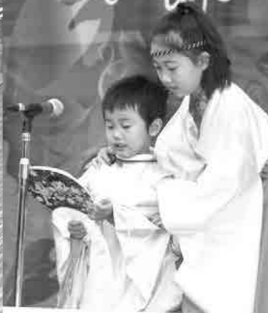
仲良く万葉歌を朗唱