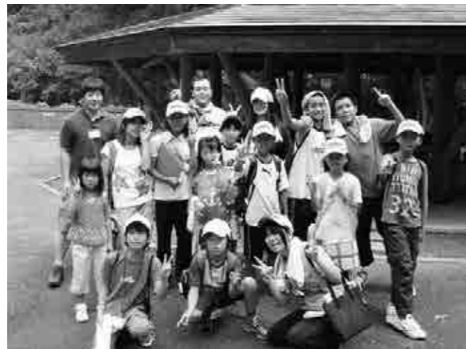
今年は、美祿市のお友達が山梨市を訪れます。みんなで歓迎しよう！