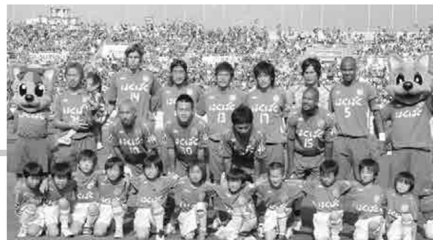
ヴァンフォーレのエスコートキッズは山梨ジュニアサッカースポーツ少年団

山梨市民の大きな声援に後押しされ、2点を先制したヴァンフォーレでしたが、ジェフに追いつかれ惜しくも2対2の引き分けとなりました。