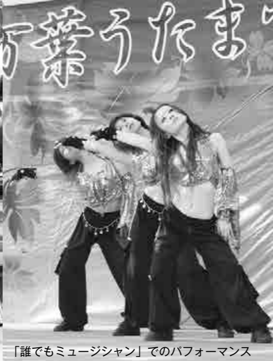
「誰でもミュージシャン」でのパフォーマンス