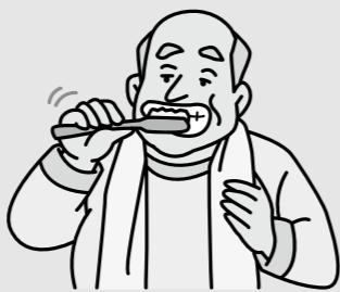
毎日、毎食後の歯磨きを欠かさず続けることが、お口の健康を守る秘訣です!