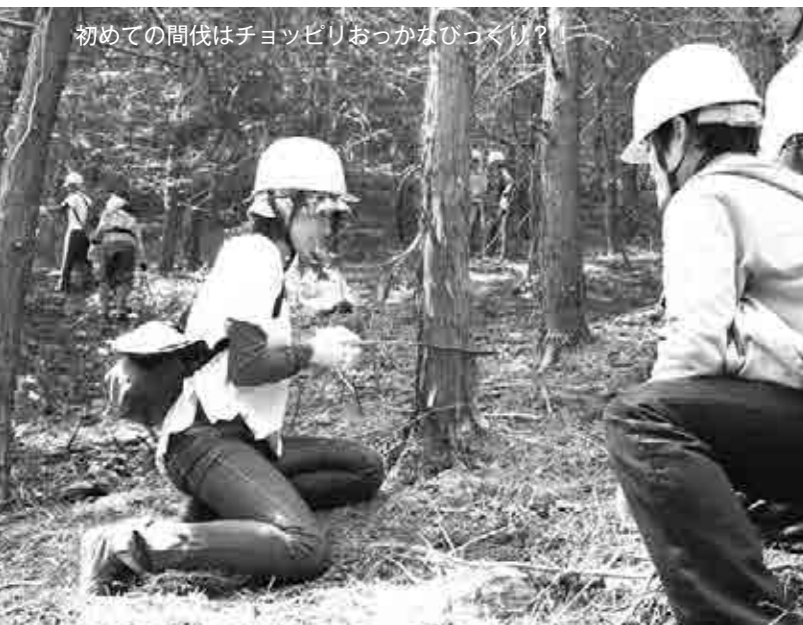
初めての間伐はチョッピリオっかなびっくり？

最後に、間伐した枝を使った「はしづくり」を行ない、参加者は満足そうな笑顔を浮かべていました。