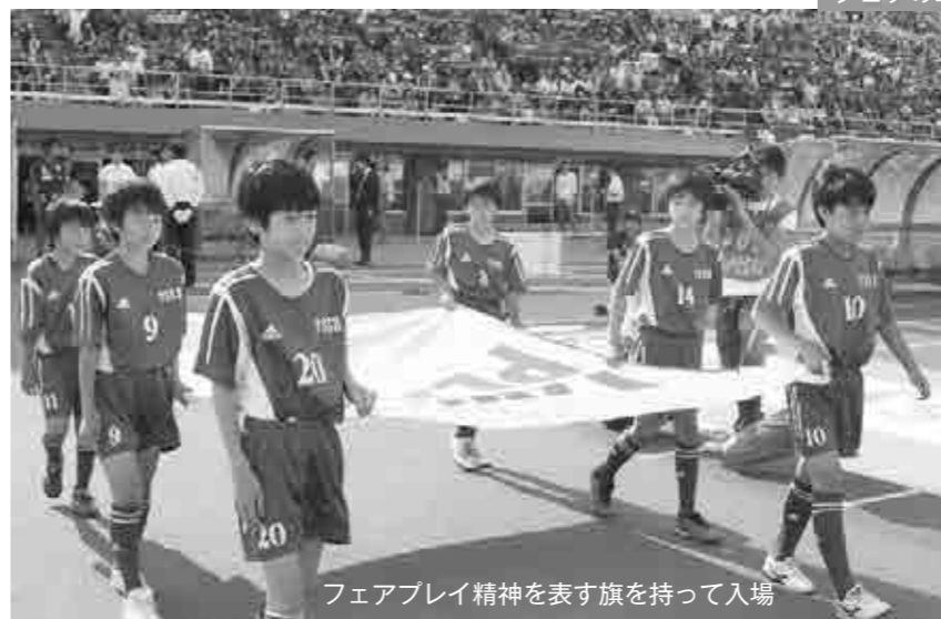
フェアプレイ精神を表す旗を持って入場