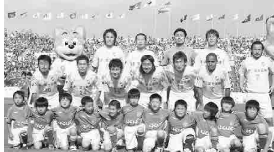
ジェフのエスコートキッズは山梨サッカースポーツ少年団