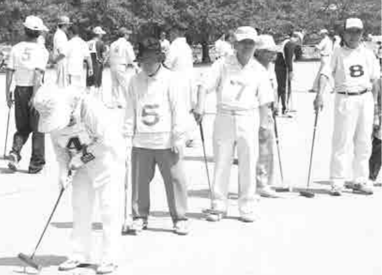
協力しあって勝利を目指すゲートボール。保険制度も世代を超えて支え合います。

※1割負担の人は、平成23年3月31日までは1割負担ですが、それ以降は2割になる予定です。