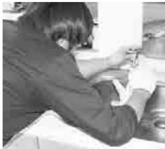
ブロの目で蛇口を点検