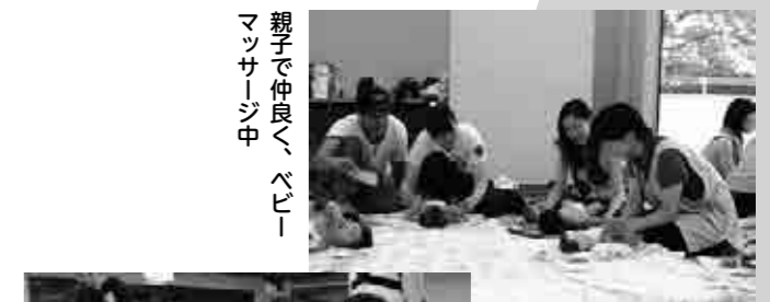
親子で仲良く、ベビーマッサージ中