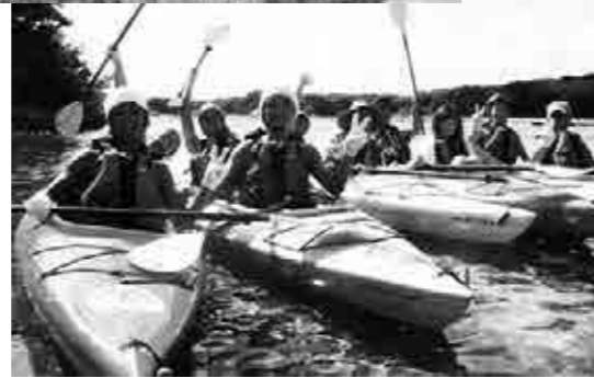
シーカヤック体験中！