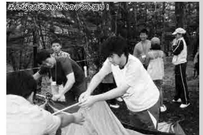
みんなで力をあわせてのテント張り！