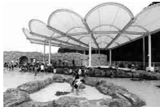
磯体験施設「海ほおずき」