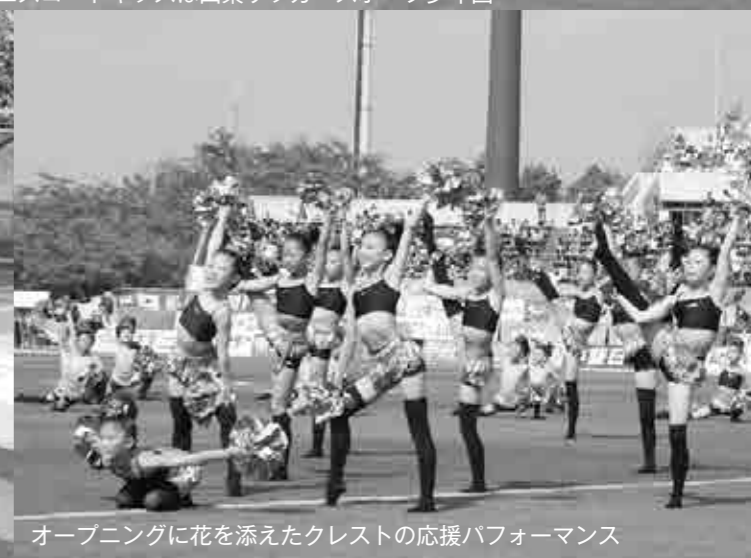
オープニングに花を添えたクレストの応援パフォーマンス