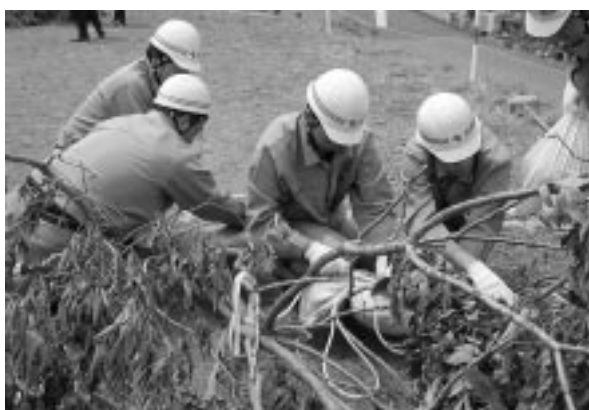
素早く作業を進める山梨市職員チーム。チームワークもバッチリ。

本番では、練習の成果を発揮し、息を合わせてテキパキと作業をこなす姿に、会場から大きな拍手が贈られました。