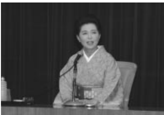
市田さんといえば、和服姿。当日も和服で登場です。

市田さんは、「今伝えたい、日本の心」と題し、自身の体験談や苦労話などを織り交ぜながら、現代の教育と子育てについての疑問や、ご自分の考えなどを、およそ2時間にわたって話しました。