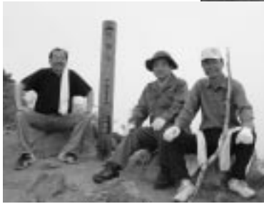
笠取山の山頂にて。