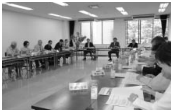
第 1 回研究会のようす

市では、今後、森林セラピーを推進することで、新山梨市の森の豊かさを再発見し、豊富な温泉、地域の特色ある食文化、文化財などを全国に広く紹介し、新たな医療と観光による医観連携のまちづくりの推進を目指してまいります。