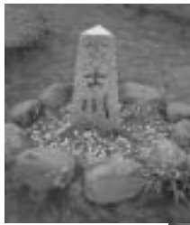
多摩川・富士川・荒川の三分水嶺（雁峠）。

また、下山後は三富地域の温泉に入り、疲れを癒しながら、「観光資源を順次視察し、今後の観光施策、地域振興に反映させていきたい。」と意見を交換していました。