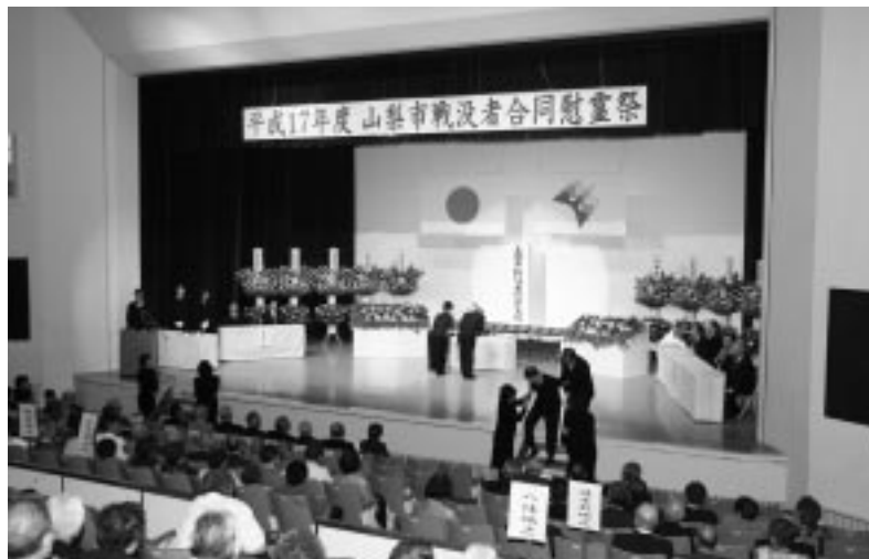
舞台中央の英霊の位に献花をする遺族。

この慰霊祭は、旧市町村で行われていた合同慰霊祭を統合し、新市において初めて合同で実施するもので、市長が祭文を読み上げた後、参列した遺族の代表が順次壇上に祭られた慰霊の位に献花をささげました。