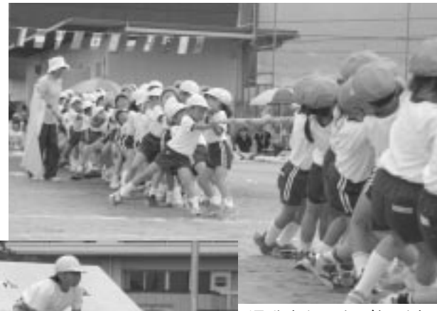
運動会といえば綱引き。ありったけの力を込めて綱を引く姿がかわいいですね。(写真上・後屋敷小) チームワークが大切な組み立て体操。小雨が降る中、がんばりました。(写真左・山梨小)