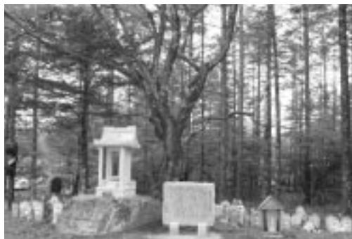
焼山峠の小楢山登山道入口にある子授け地蔵。祠と案内板が新しくつくられた。

また、6月13日には、牧丘町焼山峠に新しく建てられた「子授け地蔵社」の竣工式に出席しました。