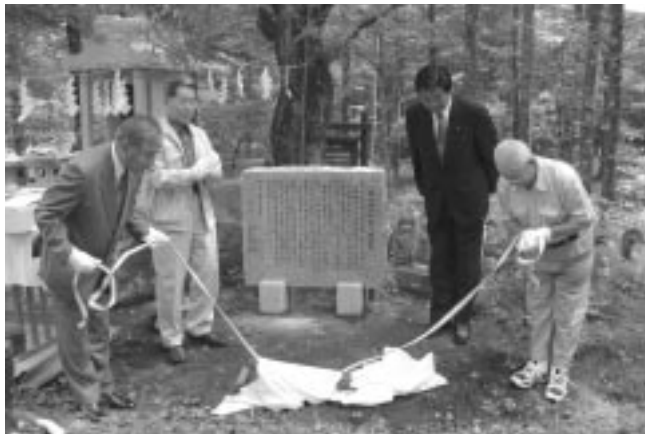
関係者が見守る中、案内板の除幕が行われました。(写真右は日原観光協会会長、左は下部同会牧丘支部長)