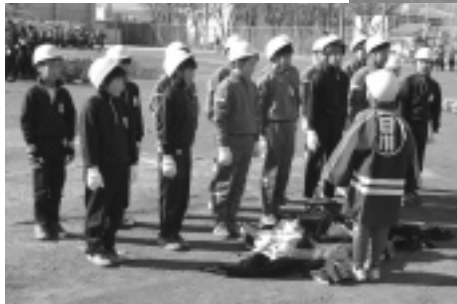
出初式で操法を披露する日川小学校6年生のみなさん

長年にわたり継承していることが認められたものです。 この受賞により、本年5月21日(土)に群馬県で開催される「平成17年度利根川水系連合水防演習」へも特別参加が要請され、6年生総勢48名が参加することとなりました。 日川小学校のみなさん、出場決定おめでとうございます。晴れの舞台、がんばってくださいね。 そして、市民のみなさん、暖かい声援をお願いします。