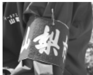
取材のときは、この腕章をつけています。ご協力をお願いします。

総務課広聴広報担当では、広報誌作成および資料収集などのために、取材・写真撮影などにより個人を特定できる情報の提供をお願いします。 また、腕章をした広聴広報担当