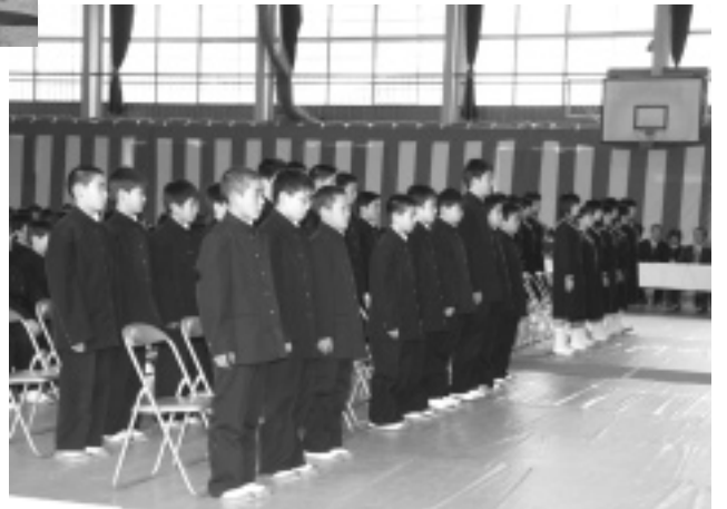
初めての制服に身を包んだ新入生。名前が呼ばれる緊張の一瞬。