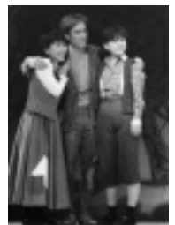
舞台「ヘンデルとグレーテル」より

ミュージカル体験で豊かな表現力をはぐくむとともに、子供たちの心に残る思い出作りをしませんか?演題は「ヘンデルとグレーテル」です。「劇団フジ」の監督さんや団員が歌や踊りやセリフの指導を行います。経験の有無は問いませんので、是非、ご参加ください。