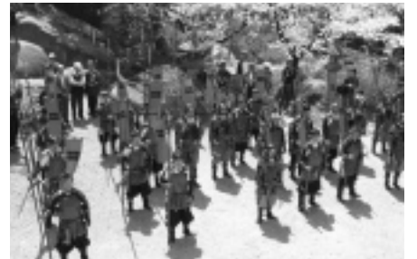
威風堂々と市内をパレード (上) 満開の桜をバックに気持ちも引き締まって (左下) 鎧姿のパパはいつもよりカッコいい!? (左中) 真田弾正忠幸隆役の矢崎公仁さん (右下)