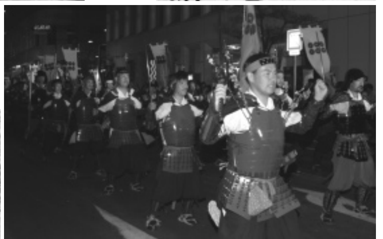
石森山での出陣式 (上) 加納岩病院前でパフォーマンスを披露 (左下) 夕方からは各地区から集結した隊とともに甲府市街を行進 (右下)