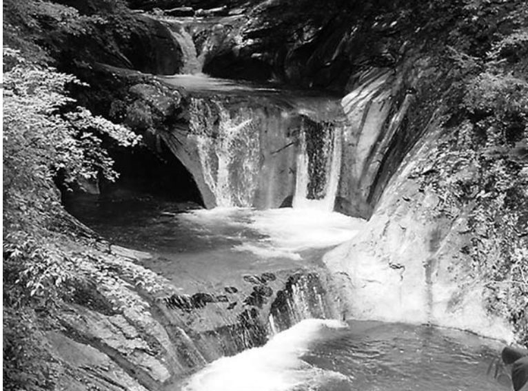
太平洋へとそそぐ水の源にある山梨市。自然の宝庫に住み、多くの恩恵を受けているからこそ、環境問題は真剣に取り組みたい問題である。

6月は、「やまなし環境月間」です。この機会にみなさんも環境について考えてみましょう。