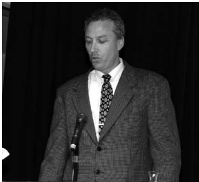
男女共同参画フォーラムで講演をされた キャラクター・リチャード氏(2月25日)

今年度は、男女共同参画についての市民アンケート調査を実施し、条例に基づく「山梨市男女共同参画基本計画」を策定する予定です。