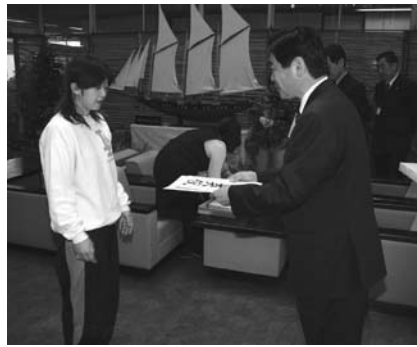
市長から祝い金と直筆の色紙が手渡されました。

市では、4月25、26日の両日、市役所において対象者のみなさんに、入学祝金10万円と市長直