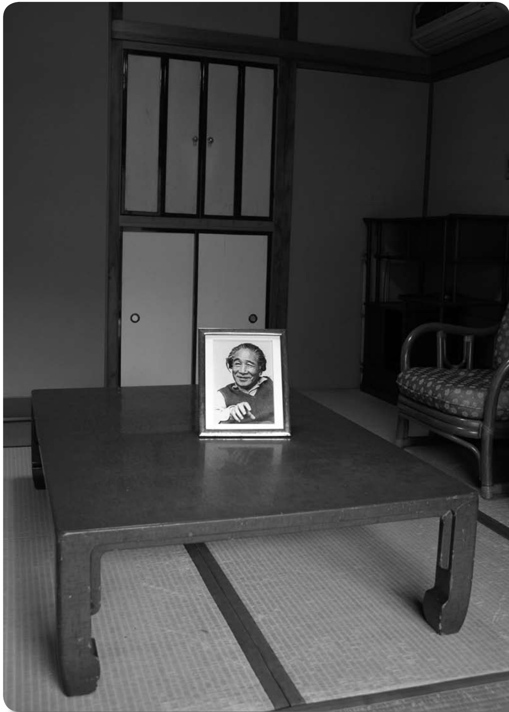
大のお気に入りだったという朱塗りの座卓と氏の写真。