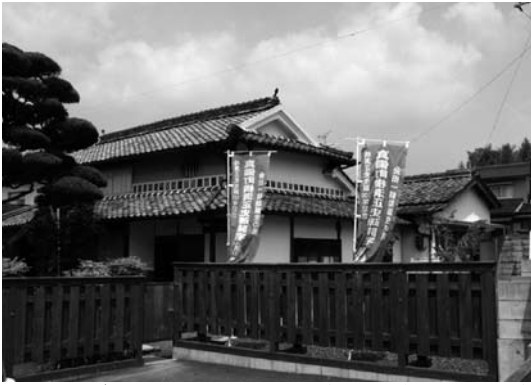
横溝正史が戦時中疎開していた家（岡山県倉敷市真備町）

倉敷中心から西へ向かい高梁川を渡って少し行くと、天平の文化人「吉備真備公」（奈良時代、遣唐使（2回派遣）として中国文化を日本に伝えた）生誕地の真備町が広がります。