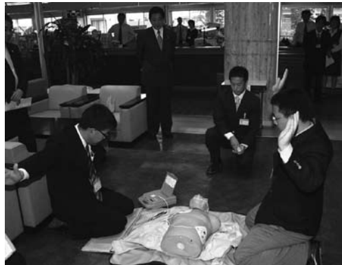
模範演技を披露する保健課職員。

赤十字救急法救急員の認定を受けた職員による心肺蘇生法とA E Dを使つての実技が披露されました。先月の広報でもお伝えしましたが、市では昨年12月から3月まで73人の職員が赤十字の救急講習を受け、A E Dを使う際に必要となる心配蘇生法ほか基本的な救急法を学びました。