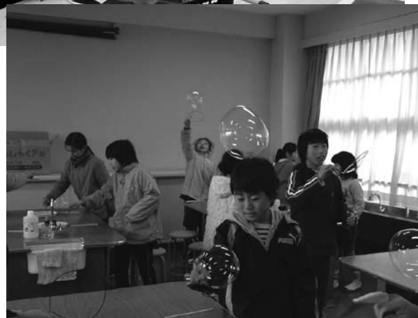
「科学する心をはぐくむ子ども教室」の一場面。万華鏡づくり(上)とシヤポーン玉づくりに取り組み子どもたち。