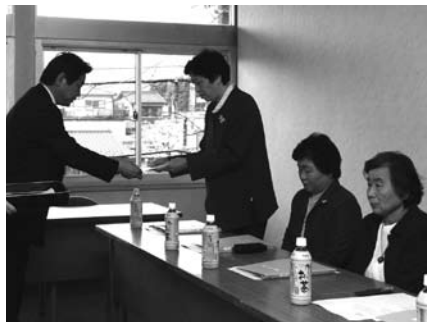
市長から委嘱状が手渡されました。

【問い合わせ】 少子対策課子育て推進担当 ☎ 11111 (内線152、153)