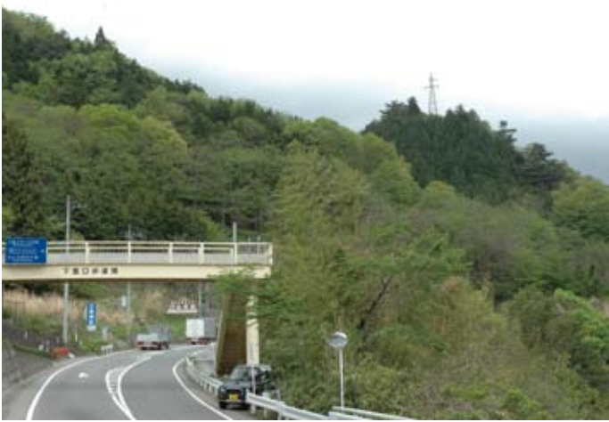
下釜口城山の烽火台。右手奥にある山の鉄塔の場所に烽火台があったと言われている。

烽火の起源は古く、日本に限っても、弥生時代すでに通信手段として利用されていたと言われる。烽火には「狼煙」の文字があてられることがある。これは火種