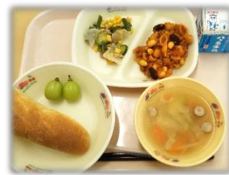
※イラスト：山梨県ホームページより

果物が実りの秋を迎えています。9月の給食にはピオーネやシャインマスカットを使用しました。今回は今年の7月18日に世界農業遺産に認定された「峡東地域の扇状地に適応した果樹農業システム」を紹介します。