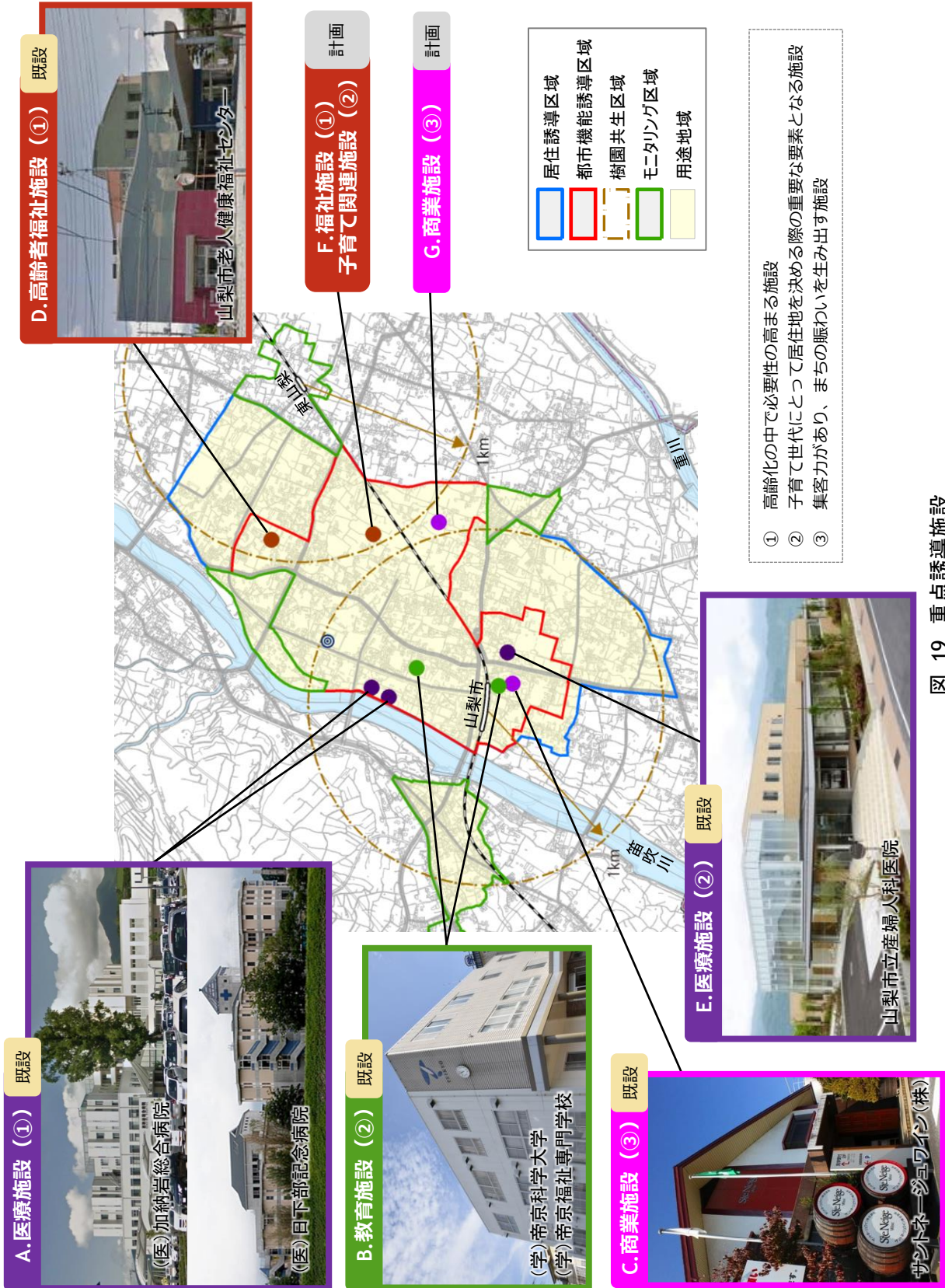
図 19 重点誘導施設

誘導施設の中で特に積極的な誘導施策を推進し、都市機能誘導区域内に新たな施設誘導や機能維持を図る施設を「重点誘導施設」とします。