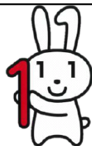
マイナンバーキャラクター マイナちゃん