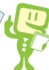
e-Taxキャラクター イータ君

帳簿の付け方や正しい決算の仕方などの 記帳・決算支援、改正税法の研修会などを 開催し、3月には申告書作成会場の「青色 コーナー」を担当しているんだよ。