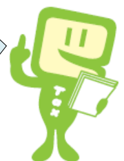
e-Taxキャラクター イータ君

山梨小売酒販組合では、未成年者飲酒防止・飲酒運転撲滅に向けた取組を実施し、飲酒事故防止に努めているんだよ。