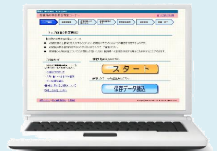
「 相続税の要否判定コーナー 」の トップ画面

◎「 相続税の申告要否判定コーナー 」の入力で困った時は・・・ 「 相続税の申告要否判定コーナー 」の以下を参照してください ・「 入力例・FAQ等 」…事例に基づく入力例やよくある質問 ・「 当画面の入力例 」…各画面における具体的な入力例 ・ 各用語のリンク (リンク設定のある用語)…各用語の説明