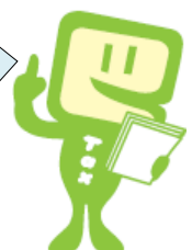
e-Taxキャラクター イータ君

山梨ワイナリー協会はね、会員の緊密な連絡懇和と相互扶助の精神に基づき酒類の円滑な納税を促進し、酒類業の健全な進歩発展に寄与することを目的としている団体なんだよ。