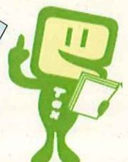
e-Taxキャラクター イータ君

東京地方税理士会甲府支部はね、税務に関する専門家として、独立した公正な立場で納税者の信頼にこたえ、国民の三大義務の一つである「納税義務」の適正な実現を図るため活動している税理士の団体なんだよ。