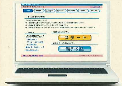
「相続税の要否判定コーナー」のトップ画面