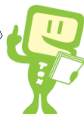
e-Taxキャラクター イータ君

また、他の税目と比べて消費税の滞納が多いことを踏まえ、消費税の完納運動・期限内納付運動も推進しているんだよ。