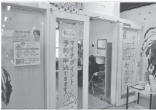
▲マイナンバーカード専用窓口

吸収量の大きいスギやヒノキなどの針葉樹も、樹齢が進むにつれ、ブナやクヌギなどの広葉樹と同程度の吸収量となる。②今後、森林経営管理制度を活用し、適期伐採により改植し、健全な森林管理を推進していく。③温室効果ガス削減を指標とし、総合的な森づくりの実現を目指している。④今後、制度への参画について、先進事例を調査研究し、民間企業への周知にも努めていく。