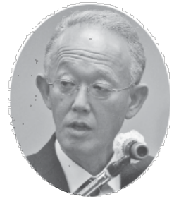
木内健司 議員 公明党