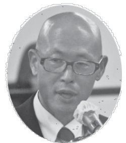
糠信平 議員 日本共産党