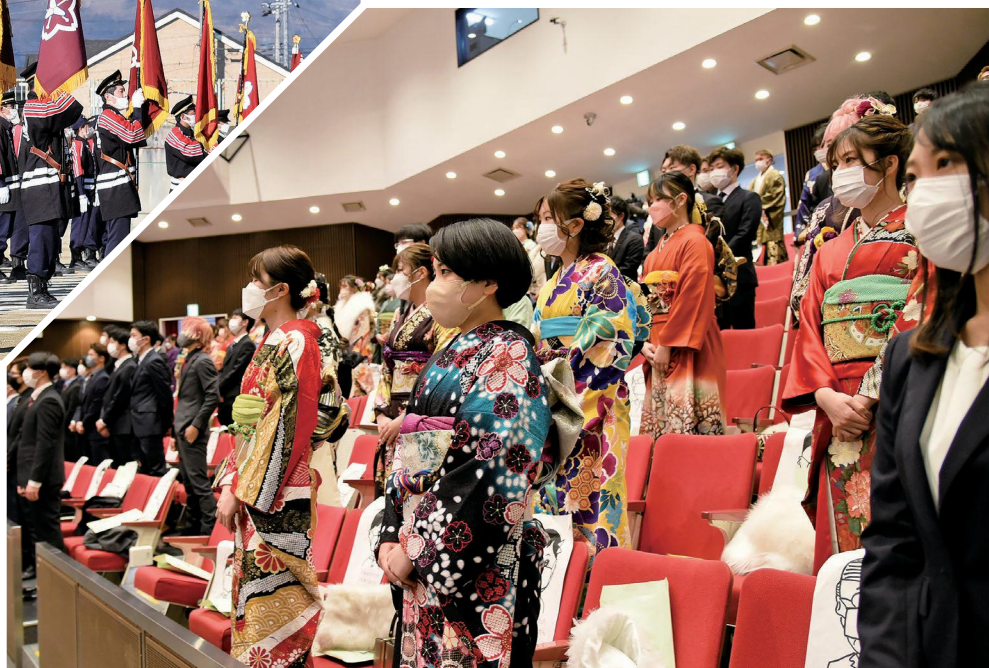
令和4年山梨市消防出初式・成人式