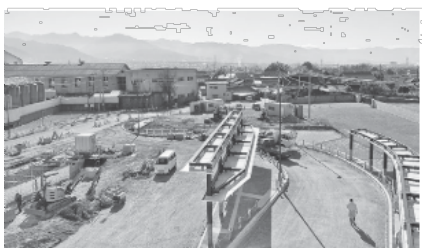
▲山梨市駅南口方面

○令和4年度予算編成にあたっての基本的な考え方について ○公共建築物の老朽化・耐震・バリアフリー等について ○公共交通の考え方について ○本市の入札制度について ○遊休農地・担い手のいない果樹園を活用した市民農園及び行政と連携した取り組みについて ○山梨市の通学路の安全対策について