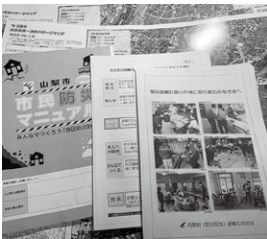
▲市防災マニュアル・ハザードマップ等