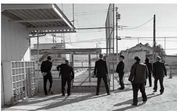
▲教育民生常任委員会視察の様子

※現地調査として、後屋敷学童クラブと、解体予定のある後屋敷小学校のプール視察を行った。