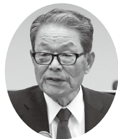
星野 洋 議員