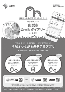
▲山梨市たっちダイアリー by 母子モ

○周辺の生活環境や安全に支障を及ぼすおそれのある居住実態への対応について ○花かげの郷まきおかの使用料のあり方について ○本市における今年度の基金の資金運用について