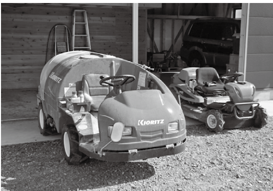
▲スピードスプレーヤー

①平成23年度に山梨市鳥獣被害防止計画を策定し、3年ごとに計画見直しを行っている。今年度に見直しを行い、現在、県と協議し修正作業を進めている。