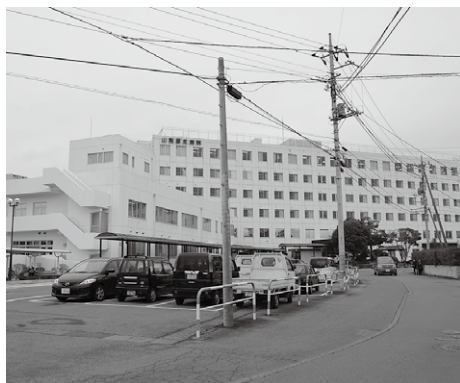
▲山梨厚生病院周辺道路

たしていることから、アクセス性向上のためにも道路の拡幅整備が必要と考える。 山梨厚生病院周辺の道路整備の現在の進捗状況について伺う。