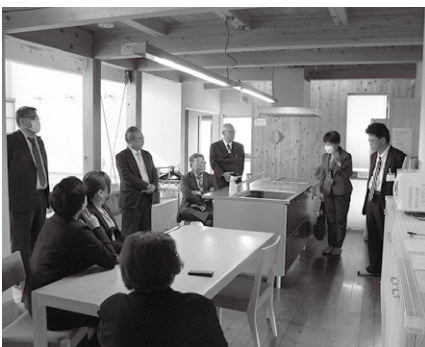
▲総務常任委員会視察の様子

※現地調査として、移住体験・サテライトオフィス事業に活用されている上神内川地内のエコハウスと、防災対策事業に係る市役所敷地内の防災倉庫の視察を行った。