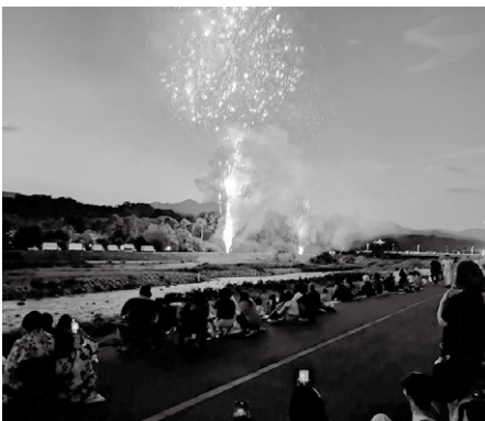
▲笛吹川県下納涼花火大会