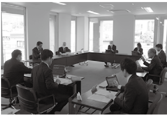
▲教育民生常任委員会での審査の様子