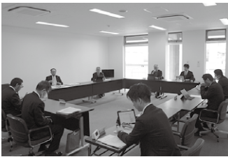
▲建設経済常任委員会での審査の様子

温泉施設のパネルフレットや温泉の素を配布することで認知度の向上を図っているほか、施設の清掃やあいさつなどの基本的なサービスを徹底することで、満足度の向上とリピーターの確保に努めている。