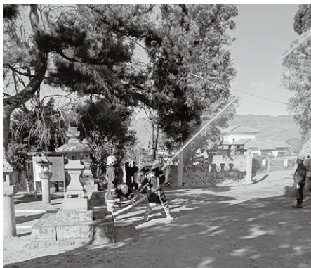
▲市消防団の訓練の様子

①現在の準備状況と、どのような体制を考えているのか伺う。②ドローン隊をどのように活用し役立てたいと考えているのか伺う。