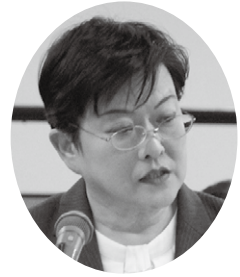
萩原弥香 議員 公明党