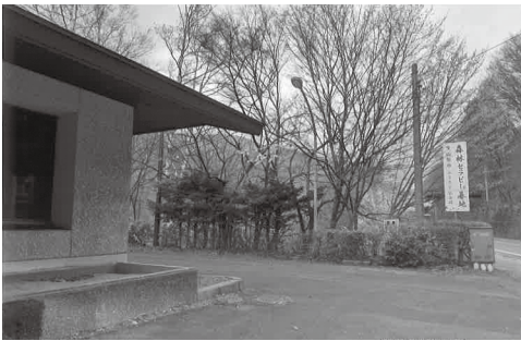
▲森林セラピー基地