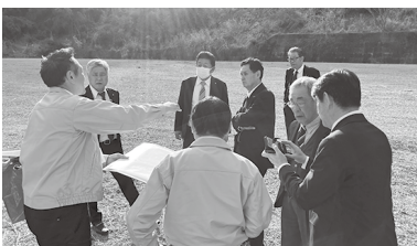
▲建設経済常任委員会視察の様子

※現地調査として、彩甲斐公園遊具更新事業実施箇所と、ジビエ軟化処理等施設建設事業実施箇所の視察を行った。