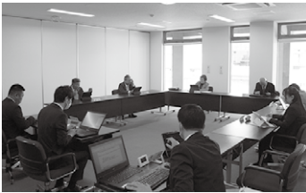
▲総務常任委員会での審査の様子

経費について、山梨市駅南口周辺整備の進捗を、多くの市民が期待している。整備に向けた構想や計画の策定に、多くの時間を要する理由について伺いたい。