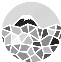
いろあふれるし、山梨市。

答 ①賦課住民基幹システムの改修が必要だが、準備を進めているので影響はないと考えられる。②収納率向上への対策として、口座振替やコンビニ収納、キャッシュレス決済等で納税環境を整えている。また、新たな取り組みとして市内滞納者を対象に、全課長による滞納整理班を編成し臨戸訪問を実施し成果を挙げたところである。