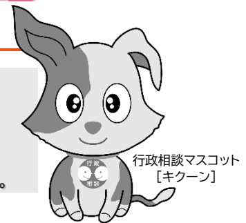
行政相談マスコット 【キクーン】