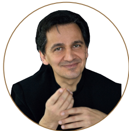
ピアニスト ブルクハルト・ケーリング

これまで20年以上にわたり歌曲伴奏のスペシャリストとして国際的に活躍し、ピアニストとしてのみならずハンブルク音楽演劇大学の教授として、意欲的に世界各国の歌曲のレパートリーを研究し、このジャンルのための新たな展望を開拓すべく身を捧げている。また、エリザベート・シュヴァルツコッフ、ヘルマン・プライといった当代一流の歌手が催す歌曲講習会の公式伴奏者であって、約10年間D.F=ディースカウと共にメロドラマの演奏会で伴奏を披露した。