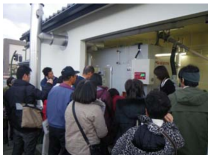
学ぶ交流事業・ツアーにおける見学の様子