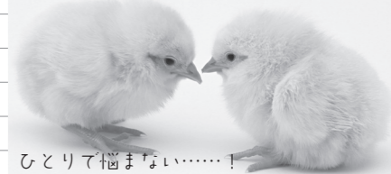
ひとりて悩まない……！

※新型コロナウイルスの感染拡大を防ぐため、相談中止の措置を取る場合があります。詳しくは各問い合わせ先へ直接ご連絡ください。また、参加の際はマスクの着用と検温の実施をお願いします。