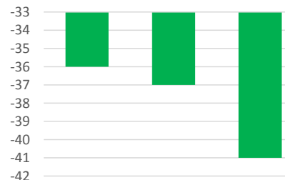
差額（歳入-歳出）の推移