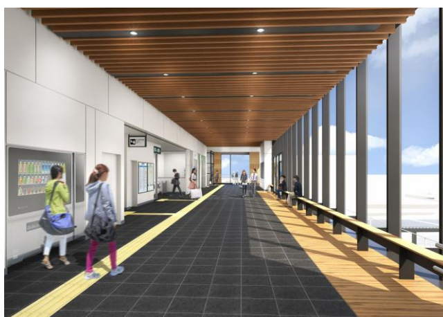
自由通路完成イメージパース