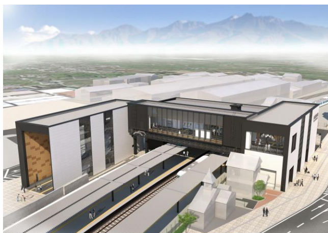
全体完成イメージパース