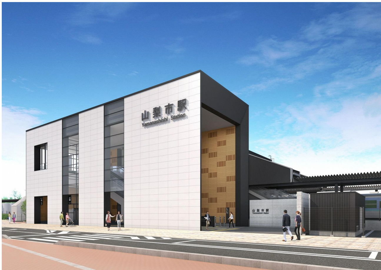
北口完成イメージパース